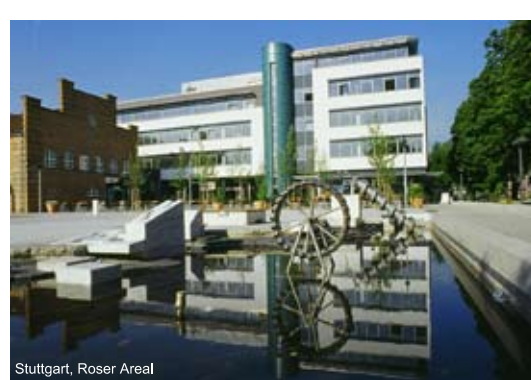
Stuttgart, Roser Areal